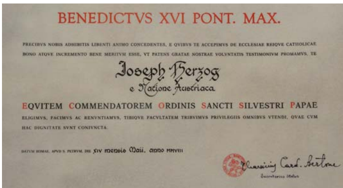
Bild 4: Verleihungsurkunde des Kommandeurskreuzes des hl. Silvesterordens